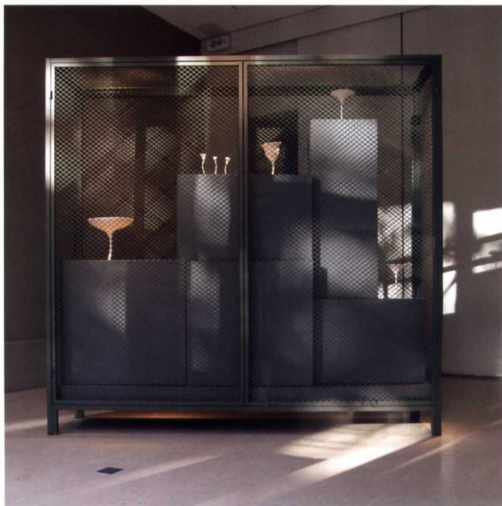
Andrea Branzi explique sa vision de la porcelaine dans le showroom Bernardaud lors des Designer's Days parisiens en 2009. Détail et Armoire Grande Gabbia, Andrea Branzi, 1991.