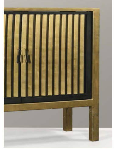
Garouste & Bonetti