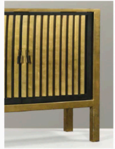
Garouste & Bonetti